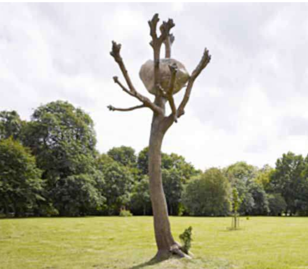
Giuseppe Penone, Idee di Pictra (documenta, Kassel)

Menschen schwer, das, was mit der modernen Kunst an Veränderung in die Welt eintrat, zu begreifen und nachzuvollziehen. 100 Jahre ist es her, dass Marcel Duchamp mit seinen Ready-Mades – also zu Kunstwerken erklärten, fertig vorgefundenen industriellen Objekten – alles auf den Kopf stellte, was man bis dahin über Kunst dachte und als grundlegend für das Entstehen von Kunstwerken angesehen hatte. 75 Jahre ist es her, dass der Nationalsozialismus versuchte, in der Kunst das Rad der Geschichte zurückzudrehen und die Moderne (und insbesondere den Expressionismus) auszulöschen. Zwar ist der Streit um die Moderne Kunst nicht mehr so vehement wie im Deutschland der Nachkriegszeit, aber die Frage, ob es nicht einen elementaren „Verlust der Mitte“ 14 gebe, wird (zumindest in der kirchlichen Diskussion 15 ) immer noch gestellt.