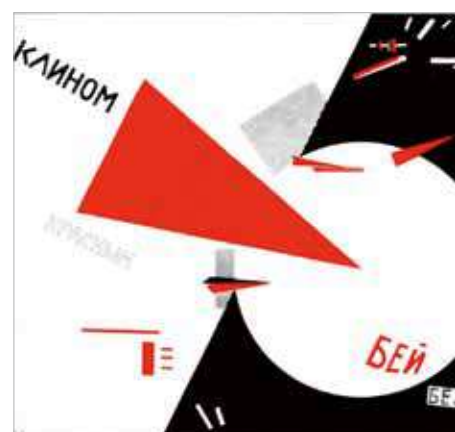
El Lissitzky: Schlagt die Weißen mit dem roten Keil, 1919

1913 stellte der französische Schriftsteller Charles Peguy fest, „dass die Welt sich seit der Zeit Jesu Christi weniger verändert hat als in den letzten 30 Jahren“. Das ist vielleicht etwas übertrieben formuliert, fasst aber zumindest den subjektiven Eindruck der Menschen am Beginn des 20. Jahrhunderts gut zusammen. „Der Schock der Moderne“ 13 ist in einem gewissen Sinne bis heute nicht bewältigt. Noch immer fällt es vielen ►