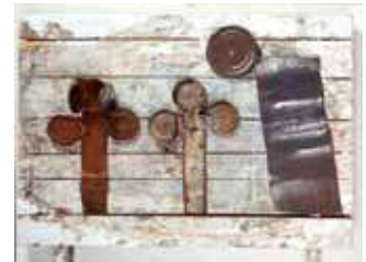
VG Bild-Kunst, Bonn 2012 sowie Stiftung Museum Schloss Moyland

Werke der bildenden Kunst als Ausgangspunkte des Erwerbs von Ausdruckskompetenz geben in ihrer Struktur als ästhetische Objekte nicht die Ausdrucksmittel und -formen vor, wohl aber die Richtungen und die Haltungen einer Suche nach dem eigenen Ausdruck. Das soll am folgenden Beispiel erläutert werden. Das Bildobjekt „Drei Jurakreuze“ aus dem Jahr 1962 von Joseph Beuys 8 besteht aus sieben roh zusammengefügt Holzlatten, die mit einer weißen Gipschicht so lasiert sind, dass die unbehandelte Oberfläche des Holzes sichtbar bleibt. Darauf sind drei aufgeschnittene Weißblechdosen montiert, die von links nach rechts sich weiter öffnende „Kreuzformen“ bilden. Die mittlere entspricht unseren Sehgewohnheiten sicher am stärksten, aber im Zuge der Leserichtung wird aufgrund der Reihung auch die einfach nur geglättete Dose mit dem nach oben wegstrebenden Deckel als „Kreuz“ gelesen.